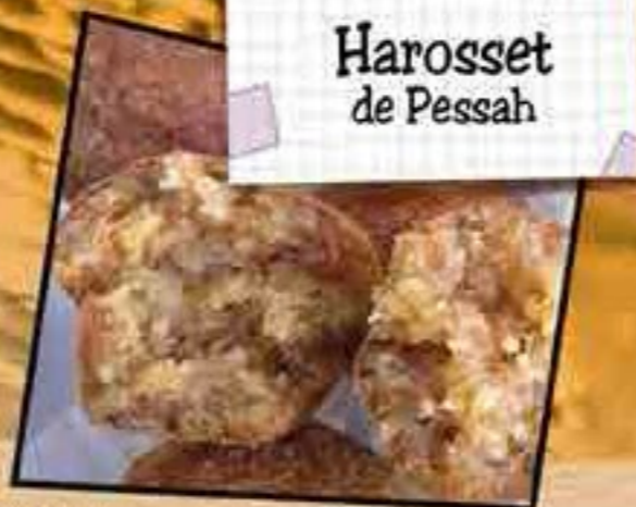
Harosset de Pessah

Retrouvez la vie juive sur internet : www.laviejuive.fr